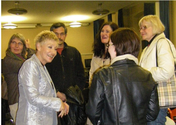
Beste Laune trotz ernster Themen beim Star und seinen Gesprächspartner(inne)n