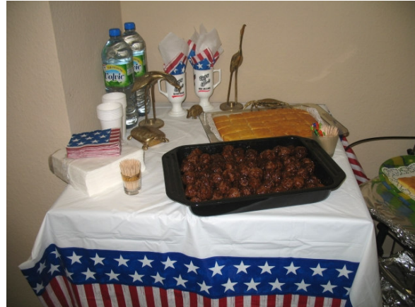
Ein feiner Nachgeschmack der Veranstaltung: original Louisiana Fleischbällchen und Maisbrot - home cooked