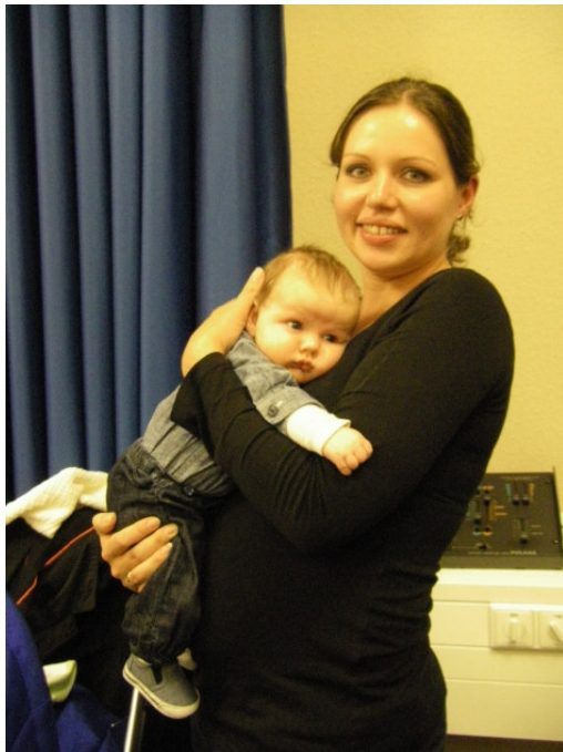
Der jüngste Zuhörer ...